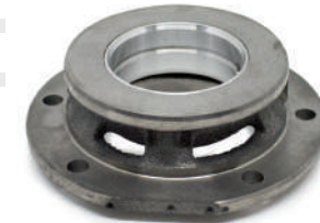
Versione in ghisa

A.4467878 STD A.4467880 020 A.4271968 040 A.4271969 060 19.A500BAR barenabile