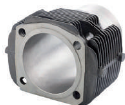
21202102 Ø 67,40 02.SA2479 Ø 70 02.SA2481 Ø 73,50 A.4379964 Ø 77,00