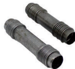
A.4459411 Lunghe 4 pz A.4459413 Corte 1 pz