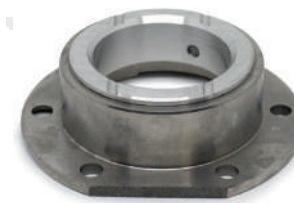
Versione in ghisa

A.4467878 STD A.4467880 020 A.4271968 040 A.4271969 060 19.A500BAR barenabile