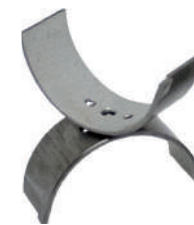
Bimetallico 19.18020STD 010 020 Trimetallico 19.18020TSTD 010 020