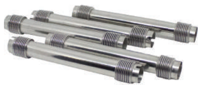
A.99114811 5 pz Disponibile anche in versione telescopica