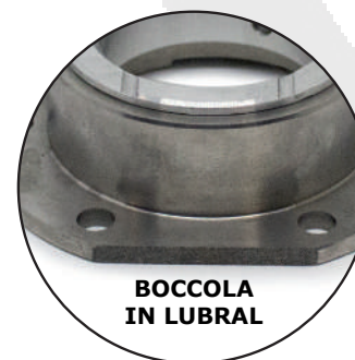
BOCCOLA IN LUBRAL