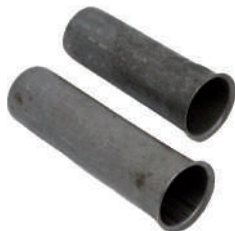
A.4353138 4 pz Lunghe A.4353139 1 pz Corte