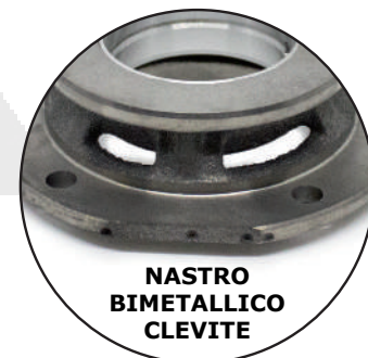
NASTRO BIMETALLICO CLEVITE